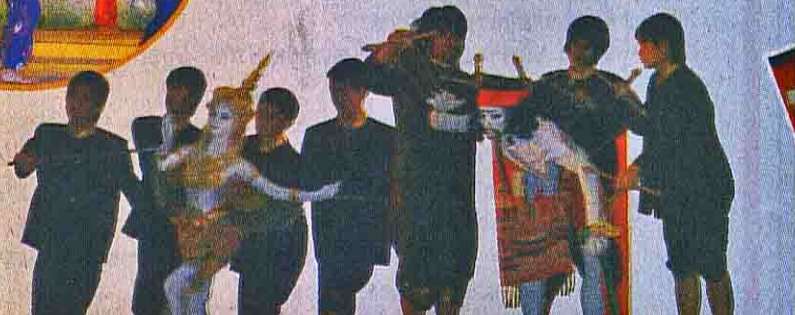
●การแสดงหุ่นคนจากมหาวิทยาลัยหัวเฉียวเฉลิมพระเกียรติ