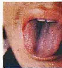
ฝ้าดำแห้ง

การดูสีของฝ้า แบ่งเป็นหลักๆ ได้ 3 สี คือ สีขาว สีเหลือง และสีเทาดำ