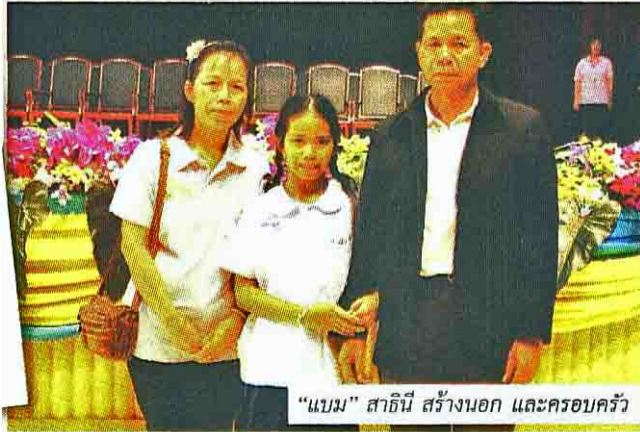
“แบบ” สาธิตี สร้างนอก และครอบครัว

หัวข้อข่าว: "หัวเดียว" ยกย่อง 400 ชีวิต ประกาศเกียรติคุณ "คนดี-เก่ง"